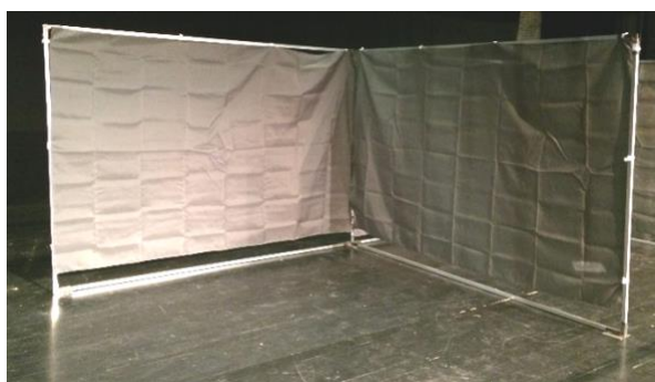
Model 1: Hjørnestand 2,98 mtr. lang x 2,80 mtr. dyb Stand med grå stofvægge ind til udstiller naboer.

Primært til udstillere som medbringer egen stand materiale. Der vil dog stadig være grå bagvæg og sidevæg ind til udstiller nabo. (hvis andet ikke er aftalt – mundtlig aftale i tlf).