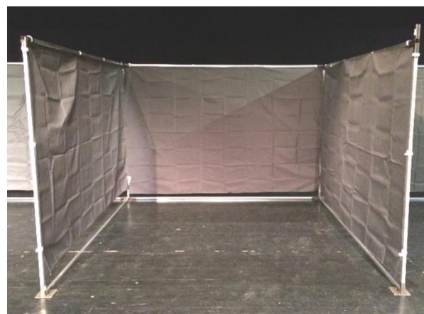
Model 2 : Almindelig stand 2,98 mtr. lang x 2,80 mtr. dyb Stand med grå stofvægge ind til udstiller naboer.